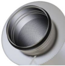
Rohrstutzen mit Lippendichtung